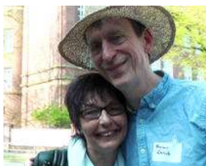
\\ Termin 1. Mai // Infotreffen Hilfe für Hamburger... von Max Bryan