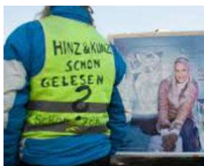
SIE kommt etwas später - aber sie KOMMT !! von Erich Heeder